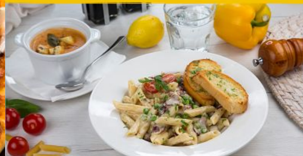
Carbonara Pasta باستا كاربونارا

صلصه رومانوز الكلاسيكيه مع شرائح البيبروني والموتازيلا الذائبة