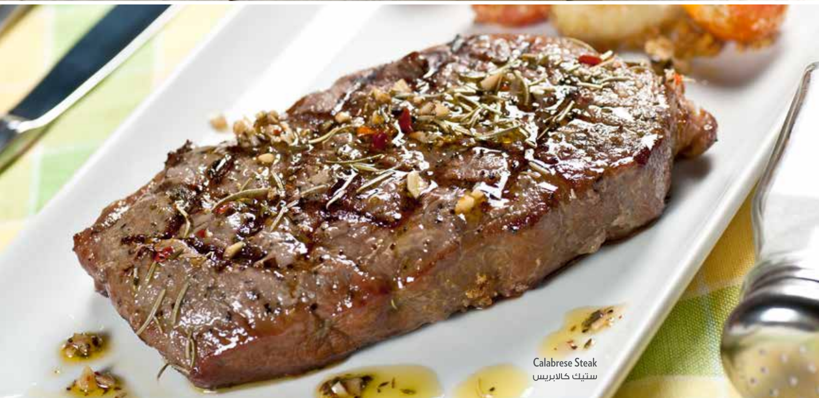
Calabrese Steak ستيك كالابريس