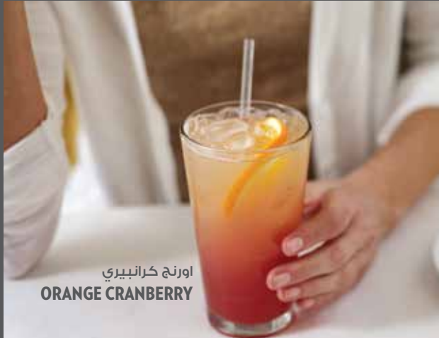
اورنج كرانبيري ORANGE CRANBERRY