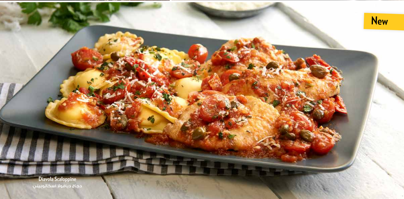
Diavola Scaloppine دجاج ديافولا اسكالوبيني