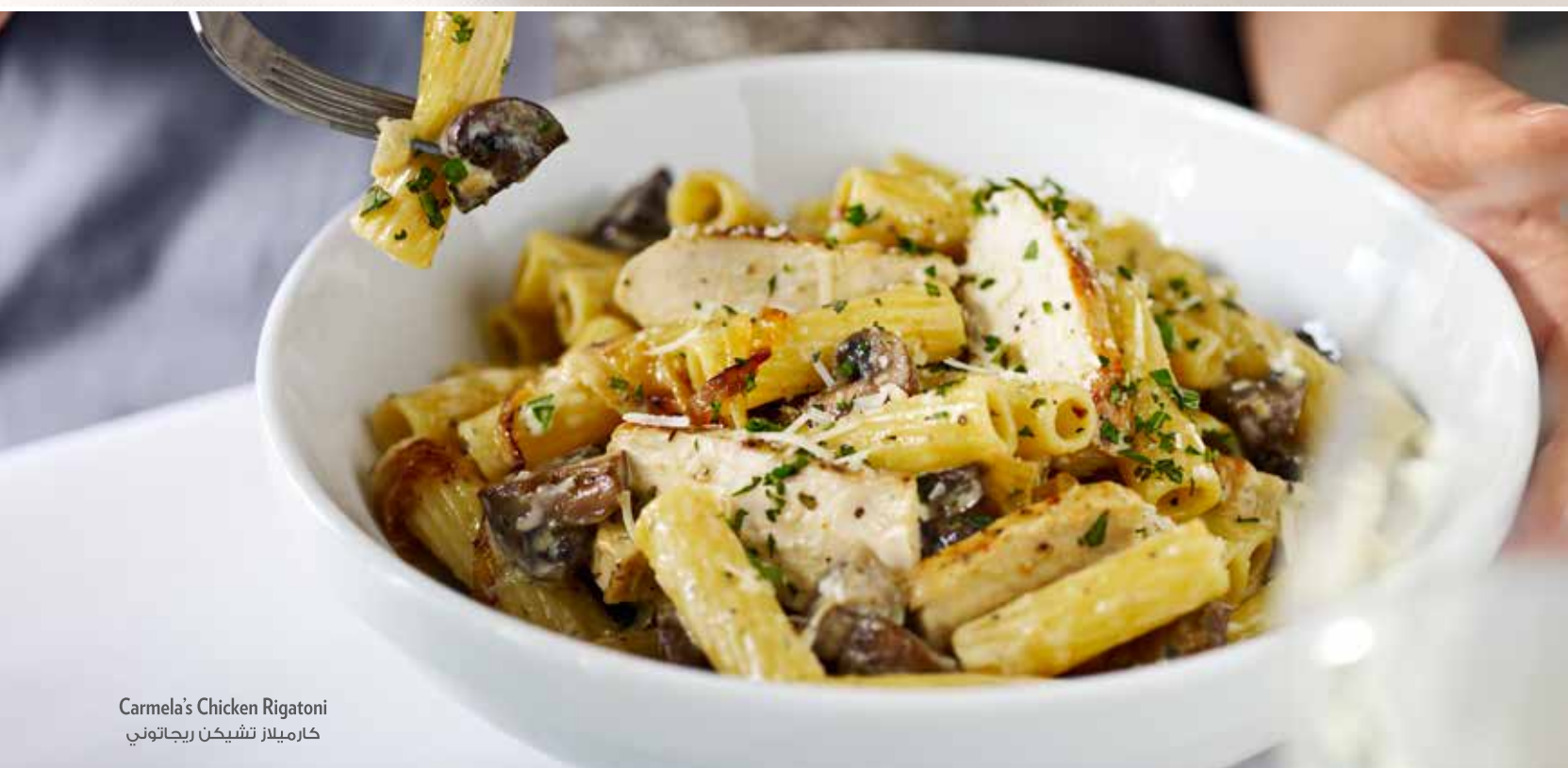
Carmela's Chicken Rigatoni كارميلاز نشيكن ريجاتوني