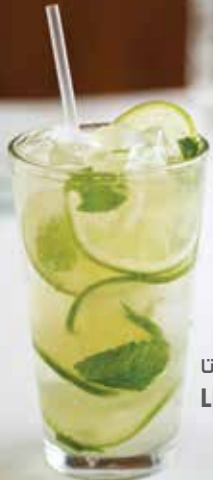
ليموناتا LIMONATA MOJITO