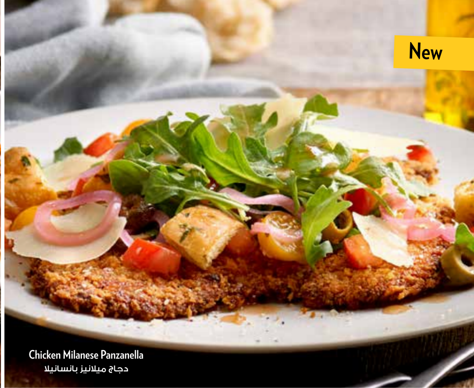
Chicken Milanese Panzanella دجاج ميلانيز بانسانيللا