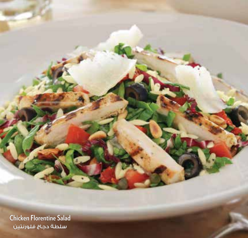
Chicken Florentine Salad سلطة دجاج فلورنتين