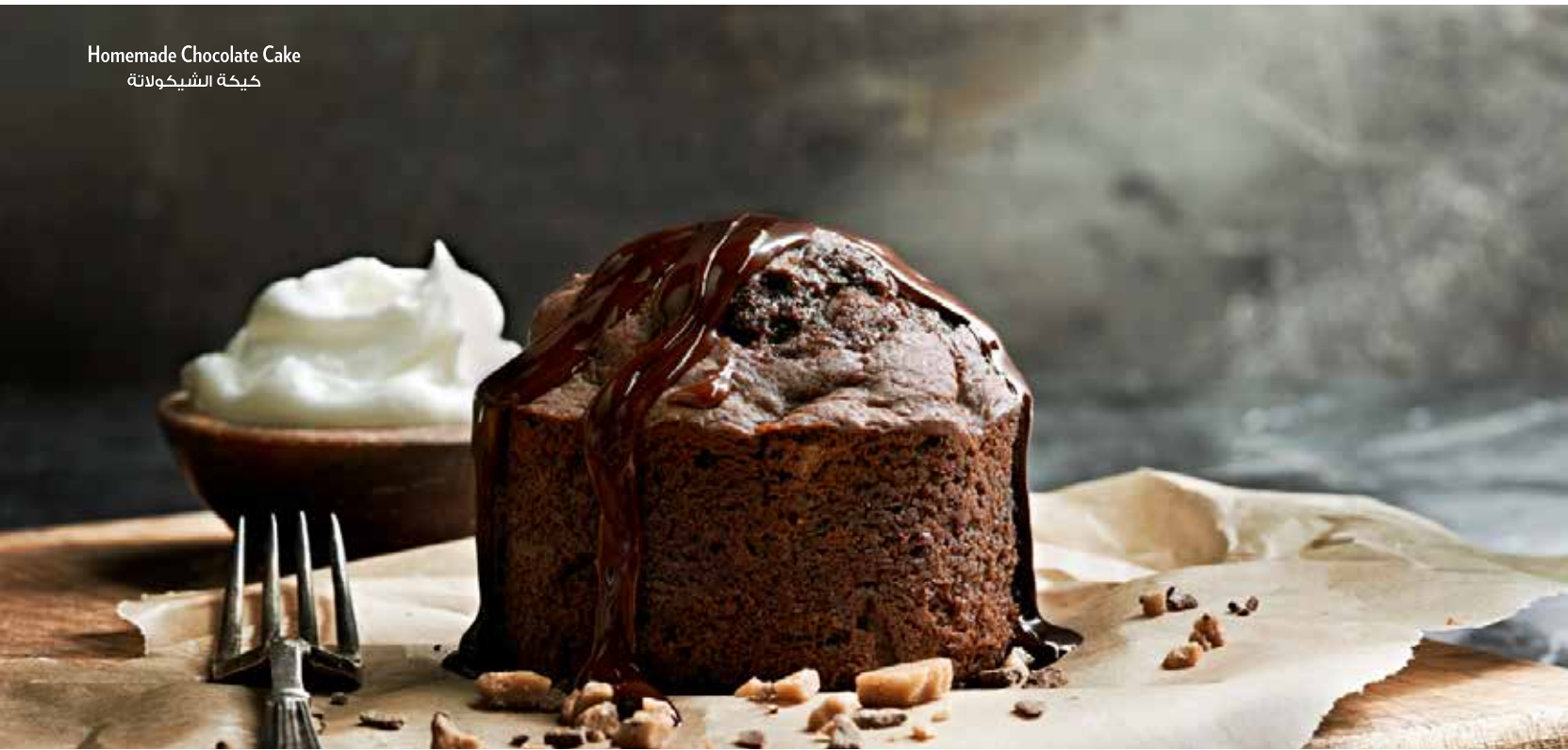
Homemade Chocolate Cake كعكة الشيكولاتة