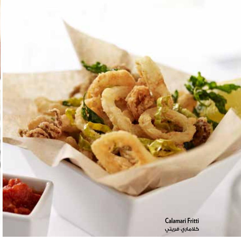
Calamari Fritti كلاماري فريتي