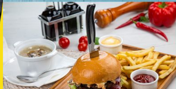
Grilled Bacon Burger البرجر المشوي مع لحم البيكون