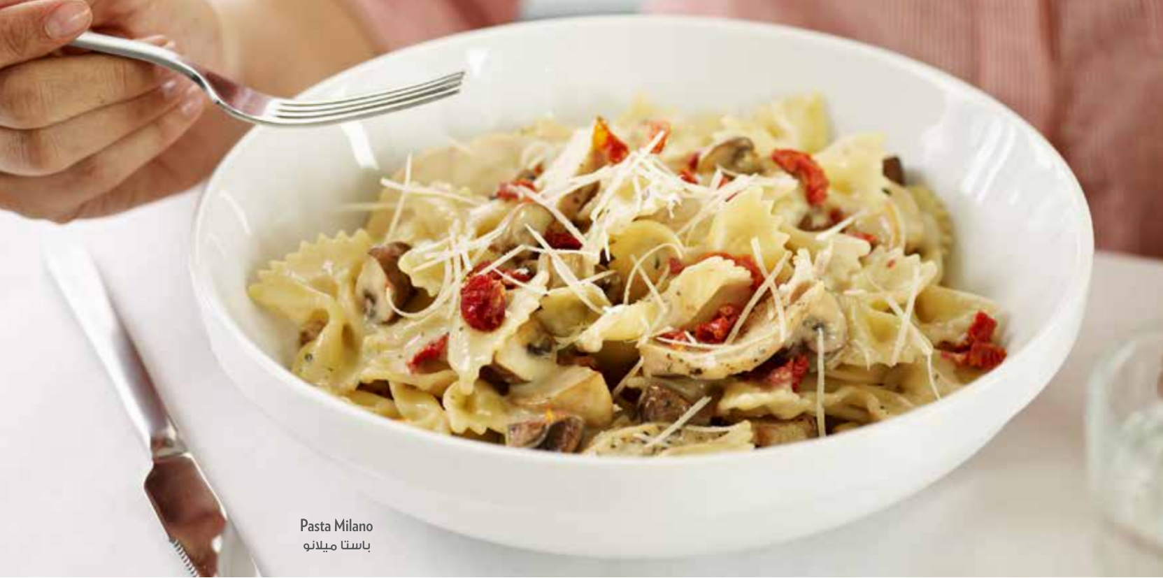
Pasta Milano پاستا میلانو