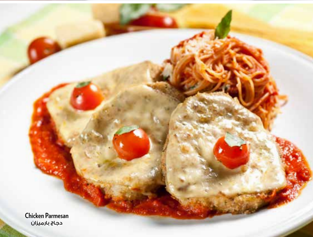
Chicken Parmesan دجاج بارميزان