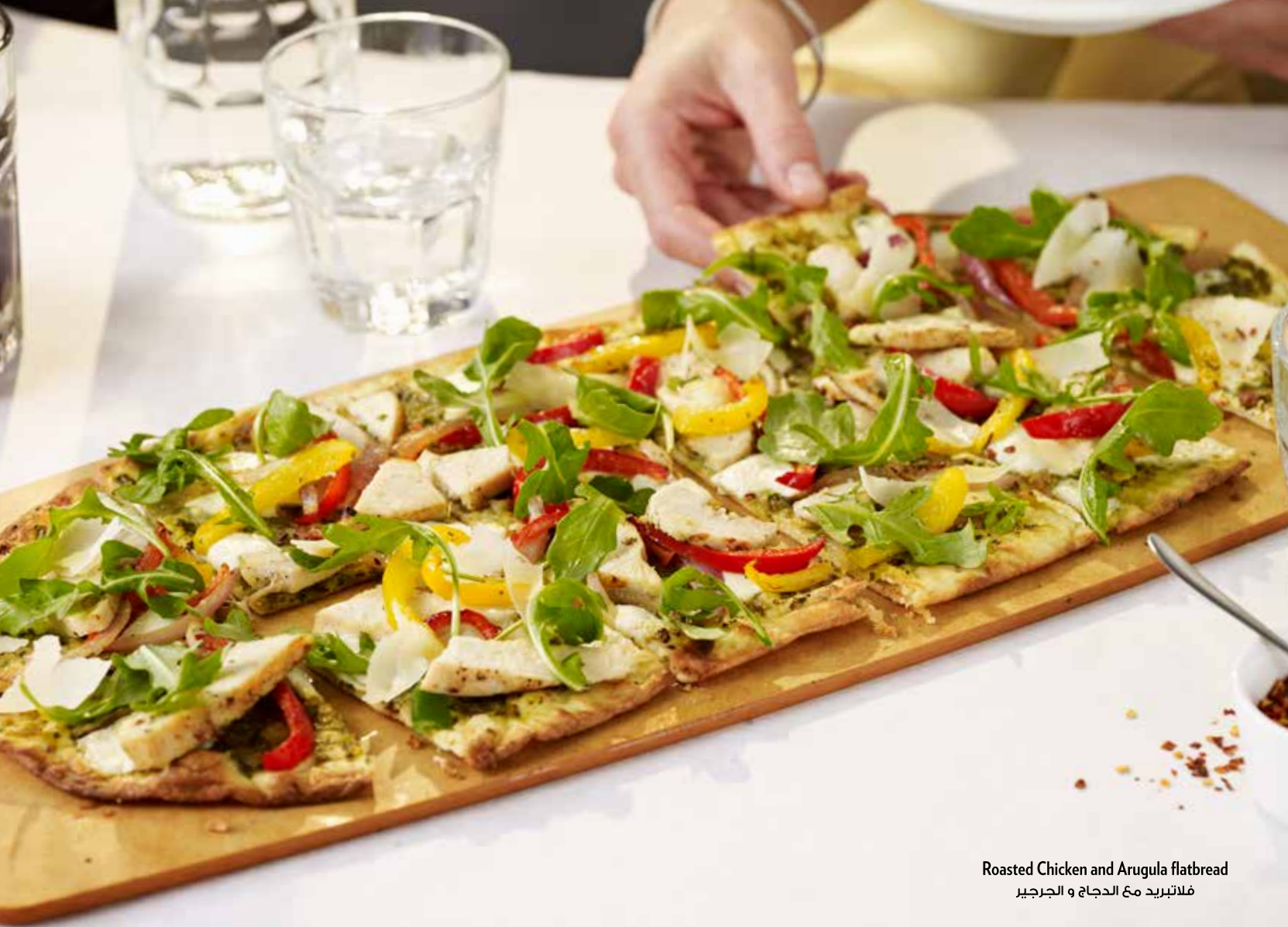
Roasted Chicken and Arugula flatbread فلانبريد مع الدجاج و الجرجير