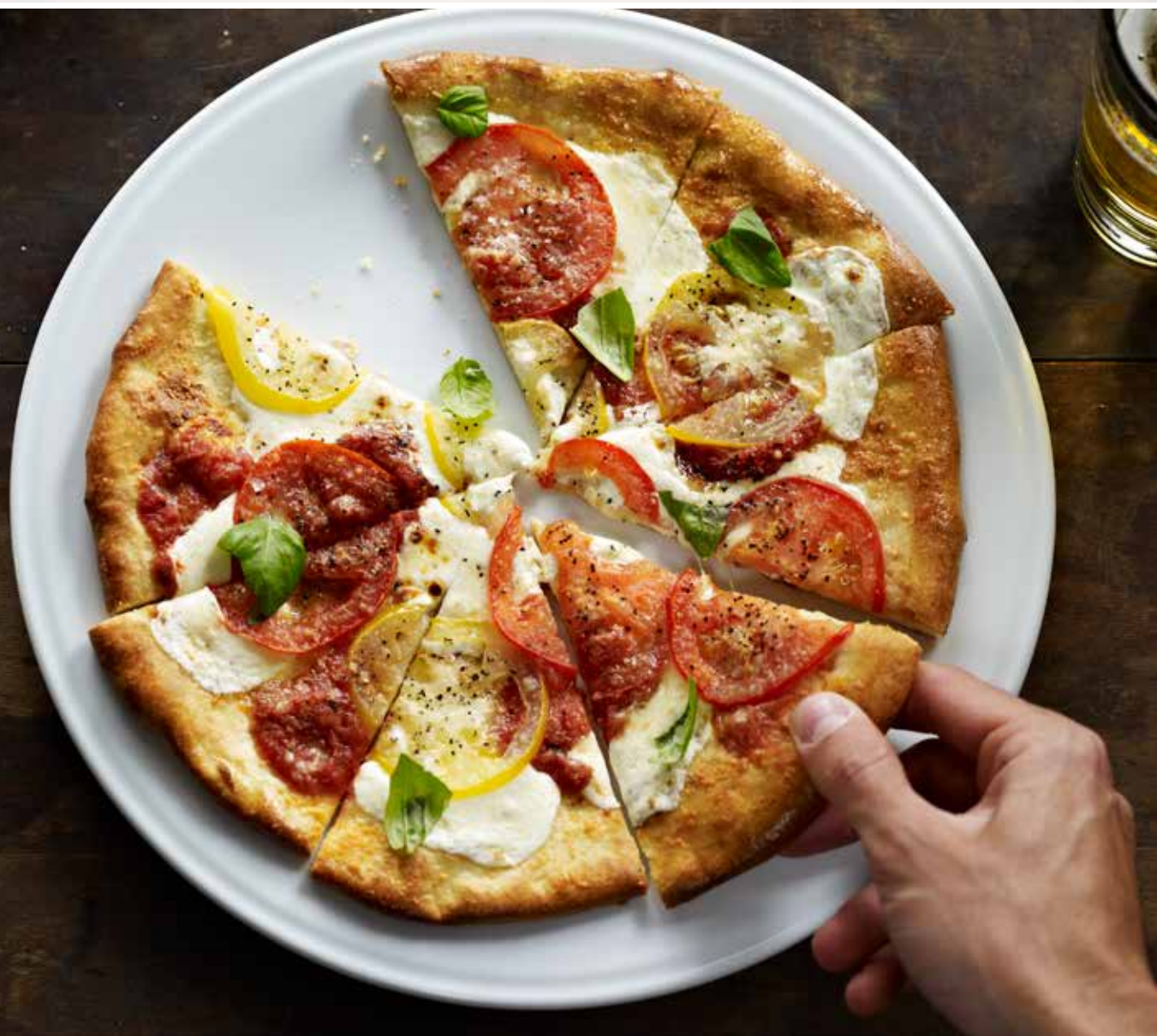
Margherita Pizza بيتزا مارجريتا