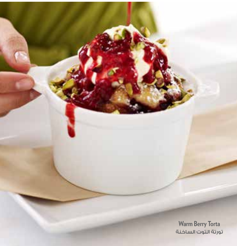
Warm Berry Torta تورته التوت الساخنة