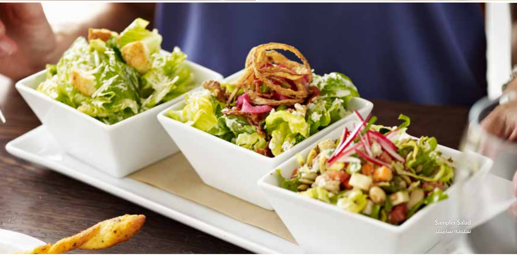
Sampler Salad سلطة سامبلر