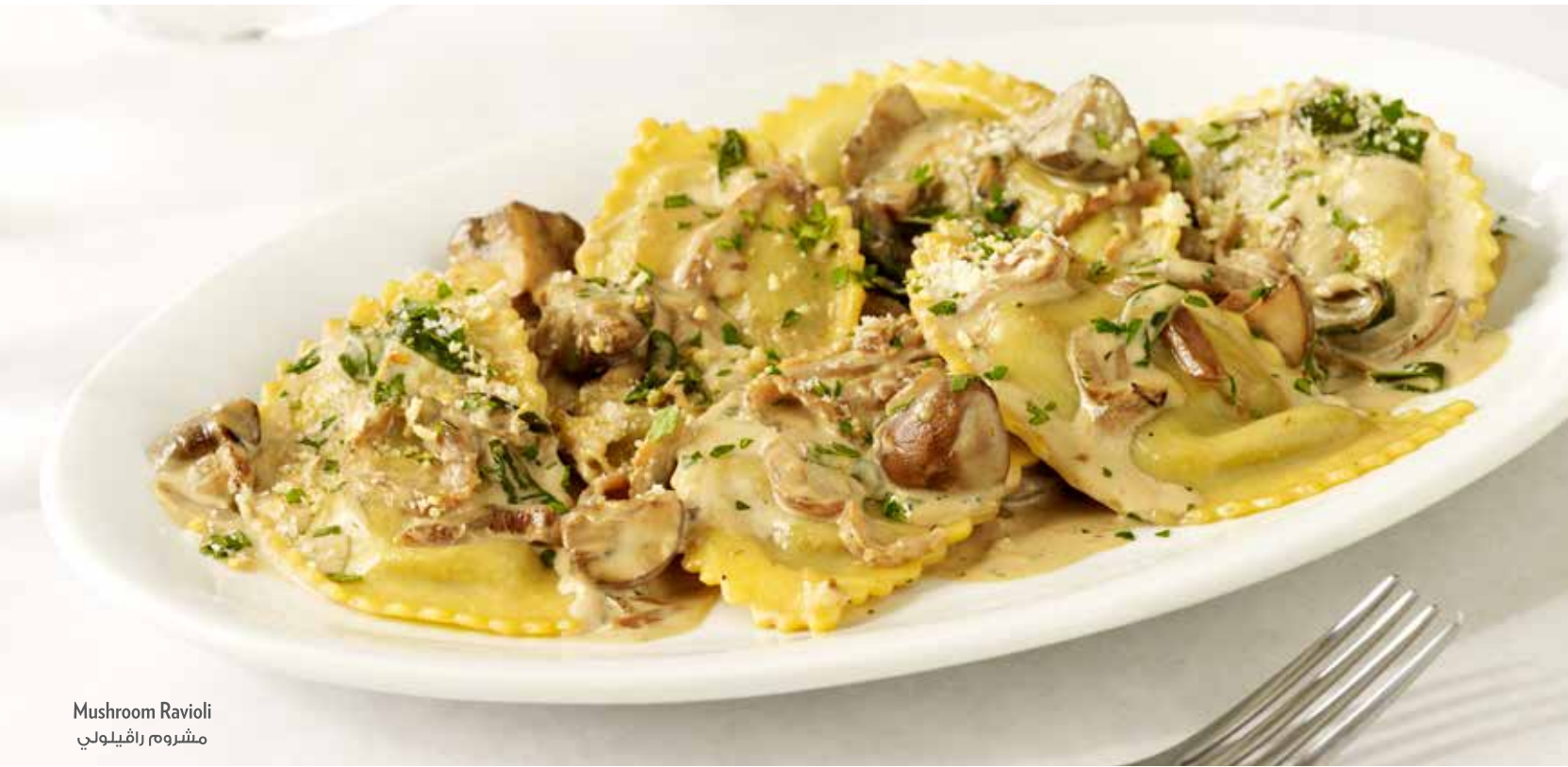
Mushroom Ravioli مشروم رافیلولي