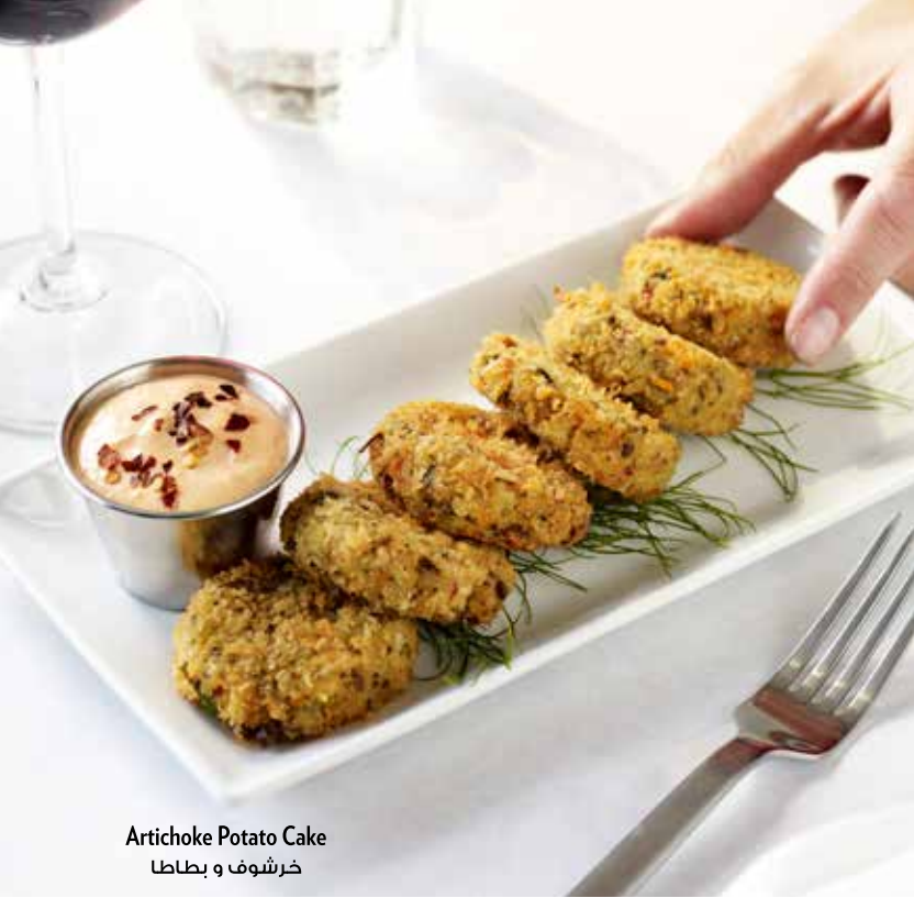
Artichoke Potato Cake خرشوف و بطاطا