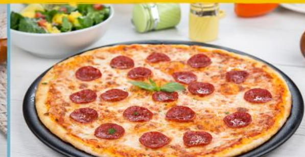
Classic Pepperoni بيتزا البيبروني الكلاسيكيه