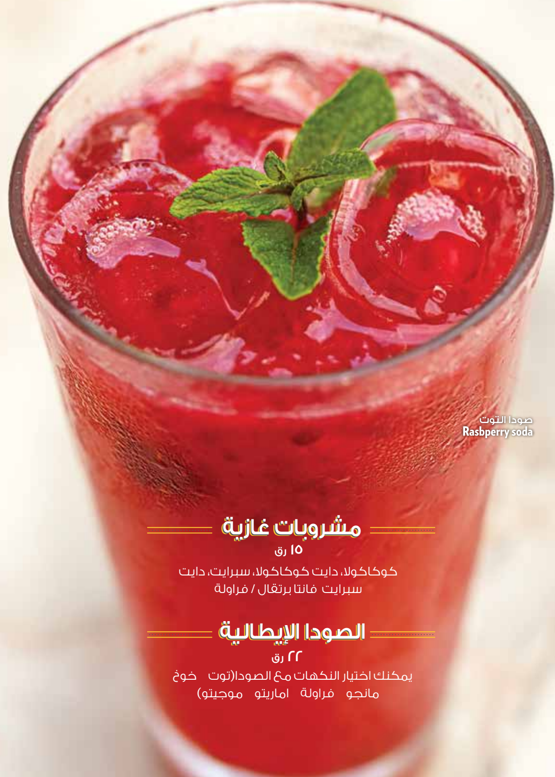
صودا التوت Raspberry soda