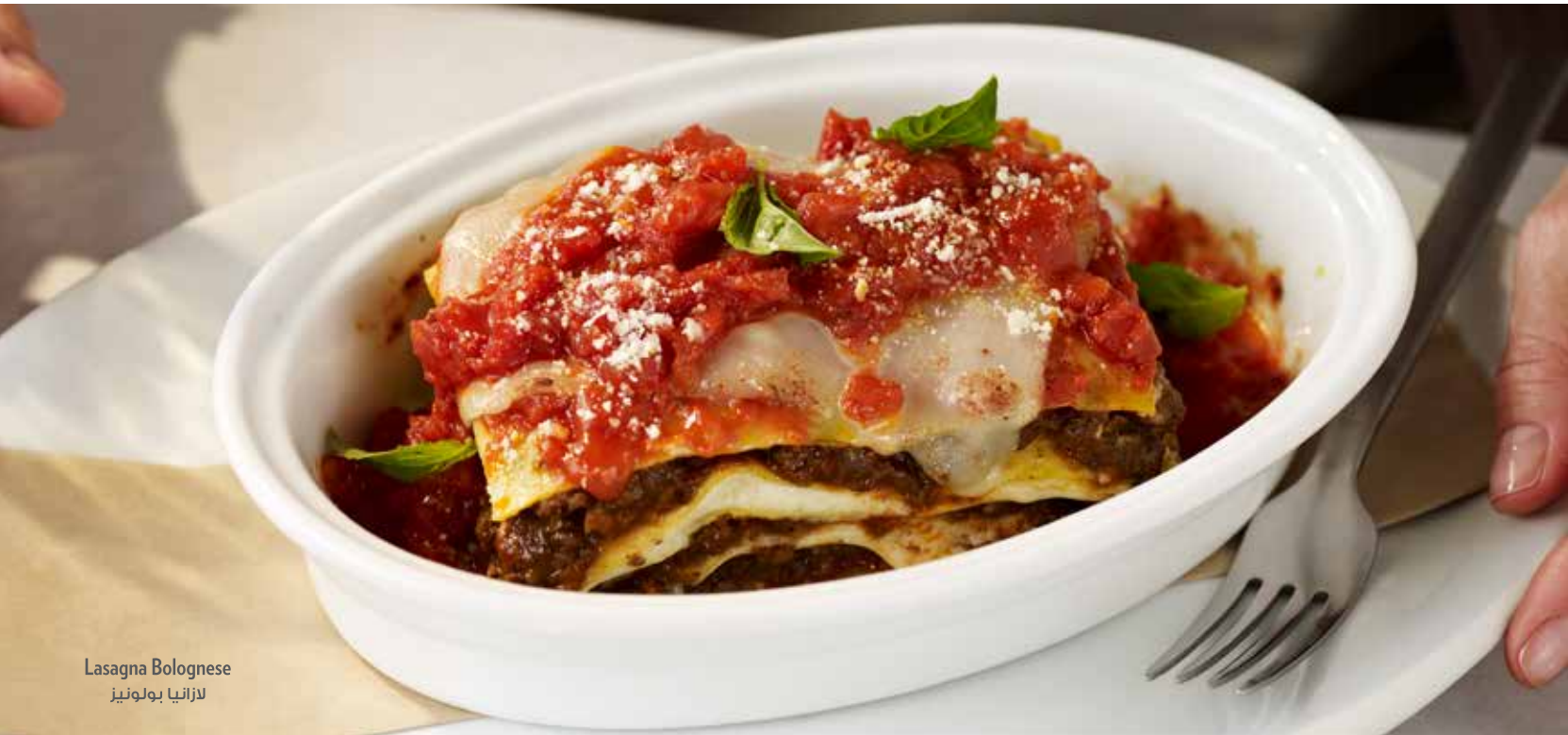
Lasagna Bolognese لازانيا بولونيز