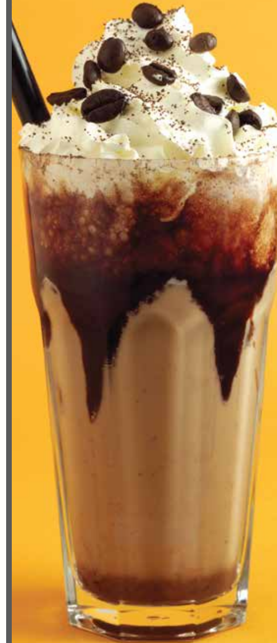
موكا تشينو FROZEN MOCHACCINO