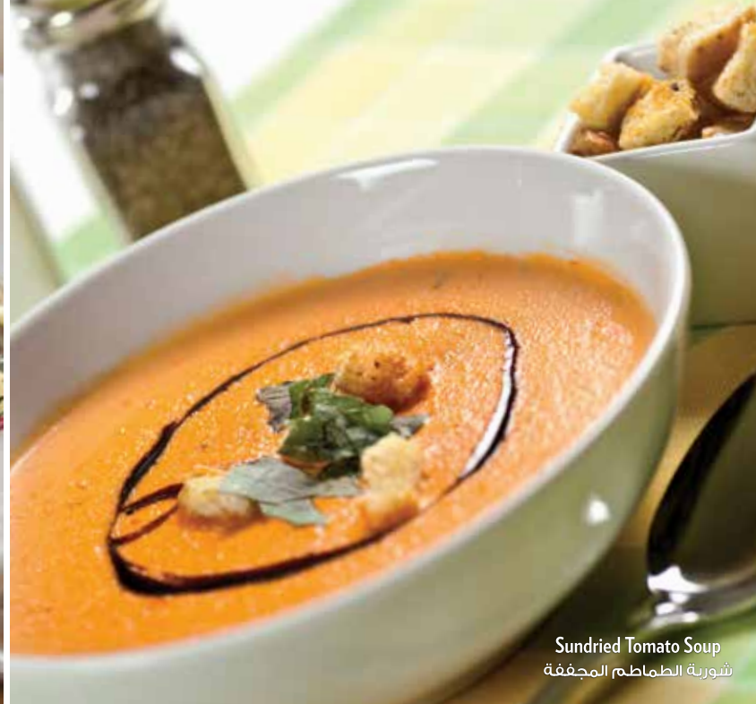
Sundried Tomato Soup شورية الطماطم المجففة