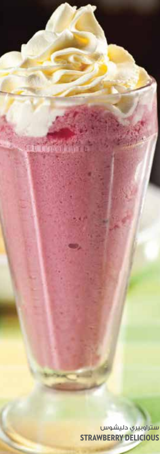
ستراوبيري دليشوس STRAWBERRY DELICIOUS