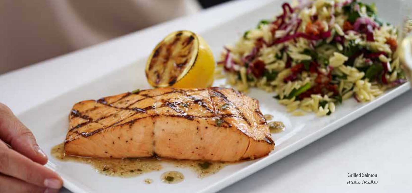
Grilled Salmon سالمون مشوي