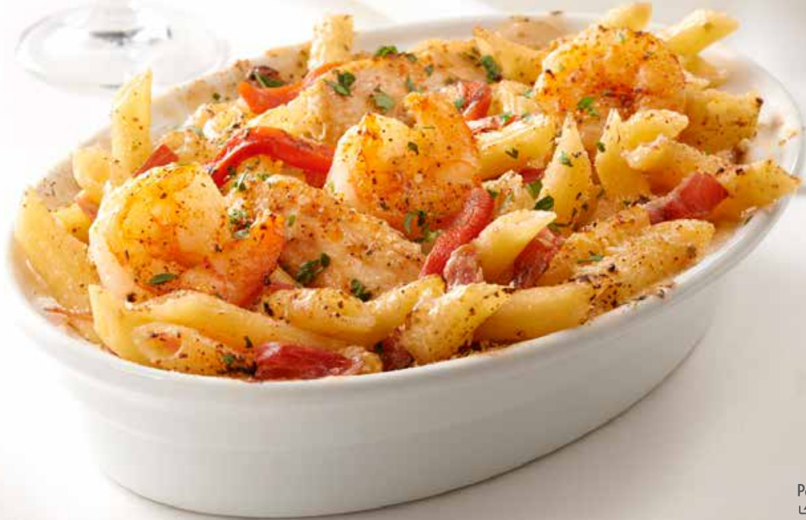
Penne Rustica بيني روستيكا