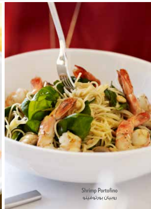
Shrimp Portofino روبيان بورتوفينو