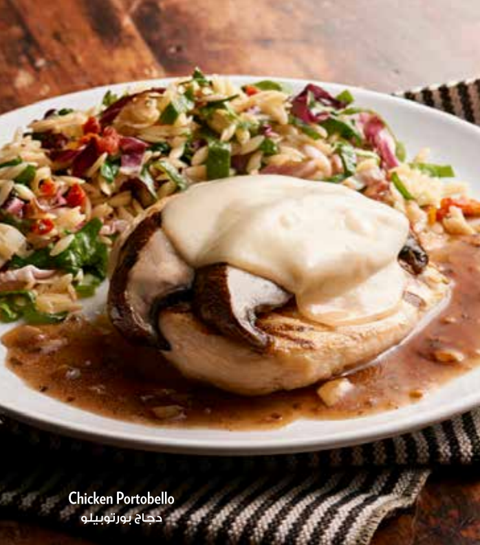
Chicken Portobello دجاج بورتوبيلو