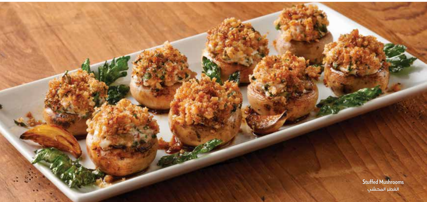
Stuffed Mushrooms الفطر المحشي