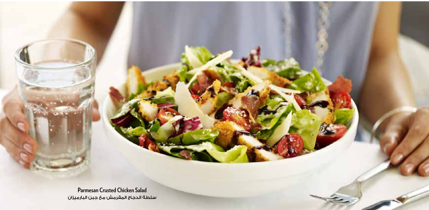
Parmesan Crusted Chicken Salad سلطة الدجاج المقرمش مع جبن البارميزان