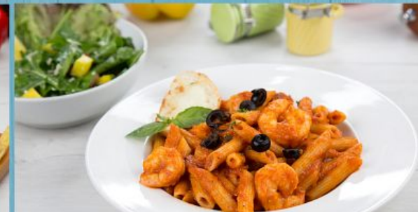
Arabiata Shrimps Pasta(spicy) أرابياتا باستا الروبيان