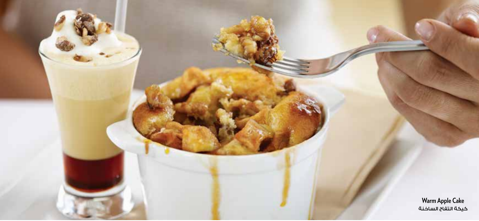
Warm Apple Cake كعكة التفاح الساخنة